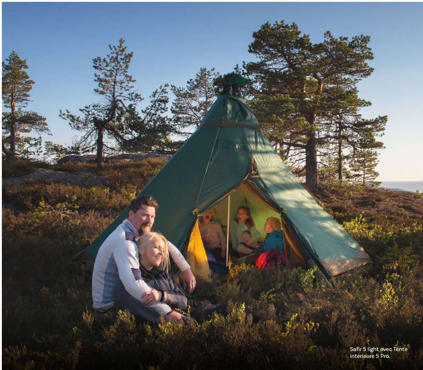
Safir 5 light avec Tente intérieure 5 Pro.